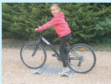
PLANCHE A BOSSES (2 pièces) MANIBOS