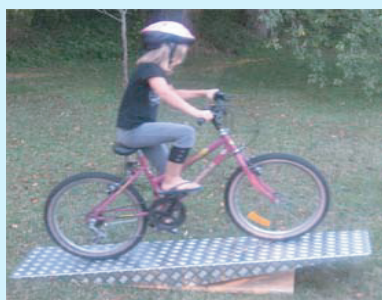
PLANCHE A BASCULE