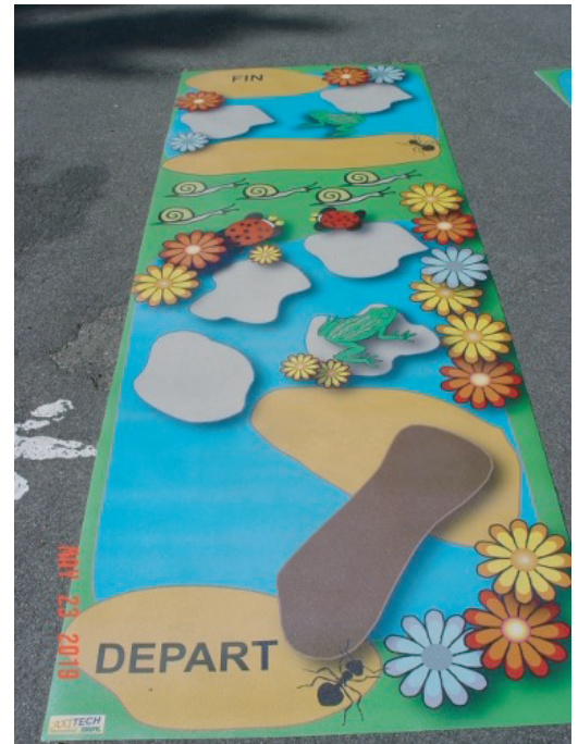
ALC 2 PARCOURS DIFFICILE